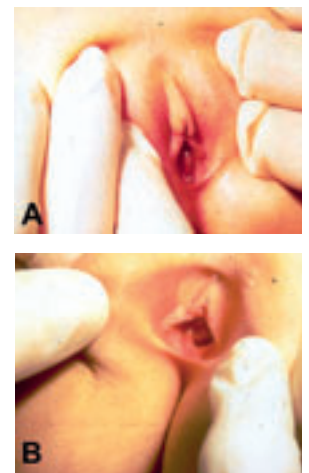
Abbildung 1: Die Untersuchungstechniken Separation (A) und Traktion (B)

Die Separationsmethode (Spreizen der grossen Labien) und die Traktionsmethode (Zug an den grossen Labien) ( Abbildung 1 ) erlauben eine optimale Beurteilung der Vulva und des Vestibulums ( Abbildung 2 ). Mit der Traktionsmethode, vor allem bei entspannter Patientin, kann man einen guten Einblick in die distale, zum Teil auch in die proximale Vagina gewinnen. Das Perineum, die Anal- und Perianalgegend sollten auch immer untersucht werden.