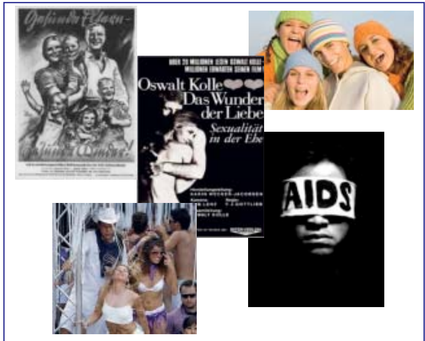
Abbildung 3: Sexualität im Wandel der letzten 70 Jahre: von der traditionellen, auf Familienbildung ausgerichteten Sexualmoral über sexuelle Liberalisierung zu neuen Werten. Junge Menschen stehen heute auf Individualität wie auch auf Treue und müssen ihren Weg inmitten vieler möglicher Beziehungsmuster finden.

In den letzten Jahrzehnten haben sich die Lebensumstände rasant verändert: Die traditionelle Familie ist geschrumpft und dereguliert, die Familien sind geprägt von neuen Lebens- und Beziehungsformen. Das verdeutlichen die Ab-